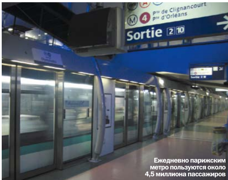
Ежедневно парижским метро пользуются около 4,5 миллиона пассажиров

2010 год стал Годом России во Франции и Годом Франции в России. В честь этого в газете «Мое метро» мы хотим рассказать об одном из самых крупных и известных метрополитенов мира – парижском.