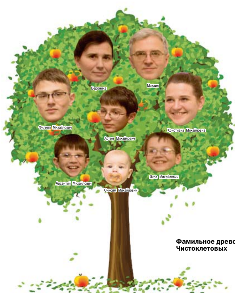
Фамильное древо Чистоклетовых