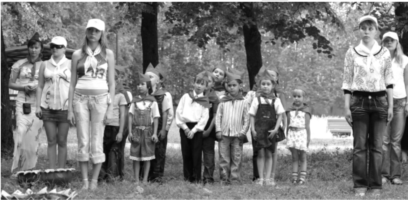
Праздник в лагере.

дия, где юные метростроевцы учатся технике речи. Это им тоже пригодится в жизни.