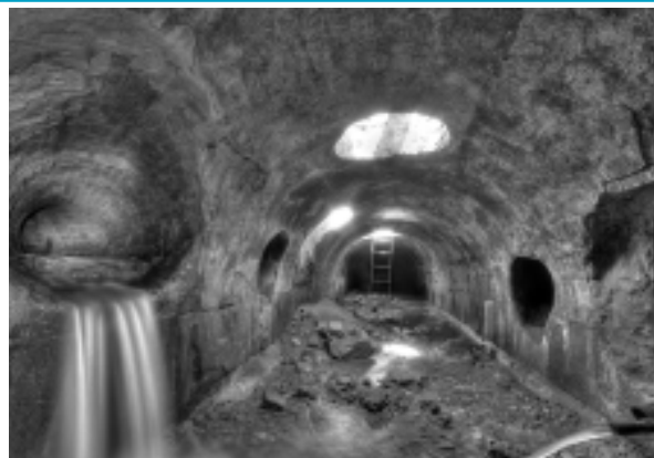
Неглинка. Старое русло.